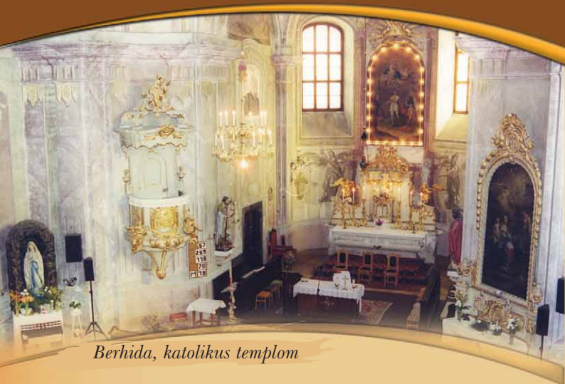
Berhida, katolikus templom

Az országban egyedül itt látható holland típusú, forogható tetőszerkezetű, hatlapátos szélmalom ipartörténeti ritkaság. A Dunántúl utolsó működőképes szélmalmai múzeumként várják az érdeklődőket.