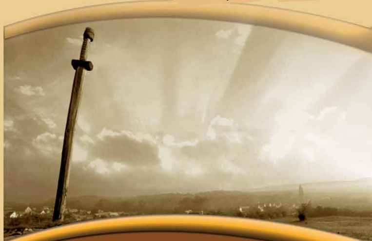
Sóly, Szent Kard

A Bakony fővárosaként is emlegetett Zircet , az ország legmagasabban fekvő kisvárosát a III. Béla király hívására Franciaországból érkező ciszterci szerzetesek alapították 1182-ben. A középkori apátságból csupán a templom egyik pillérkötege maradt meg, rajta Szent Imre herceg barokk kori szobra áll.